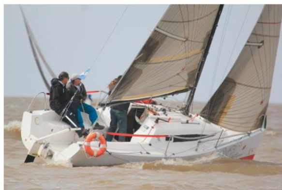
CLASE CONTE 24